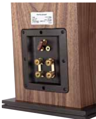
Die Steckbrücke justiert auf Wunsch den Hochtonanteil

Die beiden 130-mm-„HDS“-Tiefmitteltöner stammen aus dem Hause Peerless und werden in der P4 im Rahmen einer Zweieinhalb-Wege-Konstruktion eingesetzt. Das bedeutet gewissermaßen eine aus den beiden oberen Treibern bestehende Kompaktbox, die in den unteren Lagen mit einem im selben Gehäuse befindlichen Subwoo-