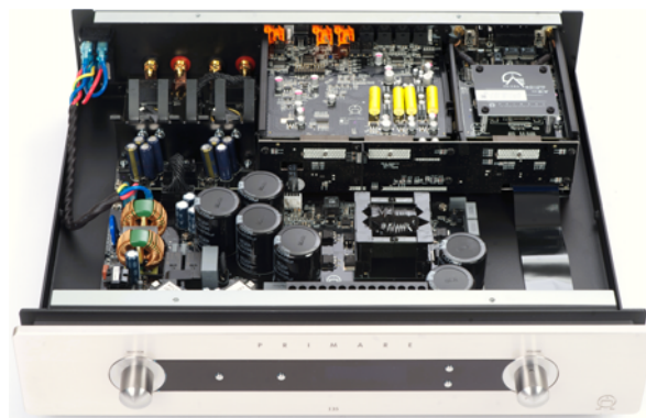
Blick ins Innere des Primare I35 Prisma

ten aus den Achtzigerjahren, die es mit luzider Transparenz nicht gar so genau nehmen und selbst tonal auch eher etwas „breitbeiniger“ aufspielen; und meine „Arbeitsanlage“, deren Komponenten auch in jedem Test zum Einsatz kommen und die technisch stets möglichst up to date sind.