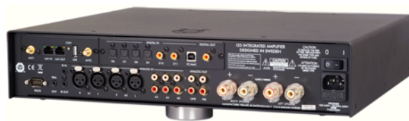
Das Anschlussfeld des Primare I35 Prisma

Der vollsymmetrisch aufgebaute Primare I35 stellt – konsequenterweise – neben drei Cincheingängen auch zwei XLR-Anschlüsse für analoge Quellen zur Verfügung. Obschon in seinem Inneren beim Umschalten der Eingänge satt klackende Relais urtümliches HiFi-Flair verbreiten, werkelt im Primare I35 nicht ein einziges mechanisches Bauteil. Selbst die beiden massiven, sämig laufenden und im Fall des