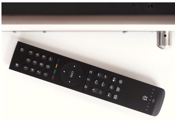
Eine Fernbedienung hat der Primare I35 natürlich auch

hensweise: Die sogenannten „Cast Services“ – das sind schlicht Wiedergabedienste, die mit Googles „Chromecast“ kooperieren (etwa Spotify, Deezer, Tunes und andere) – werden aus der Prisma-App heraus geöffnet, ihre Inhalte dann aber via Chromecast abgespielt.