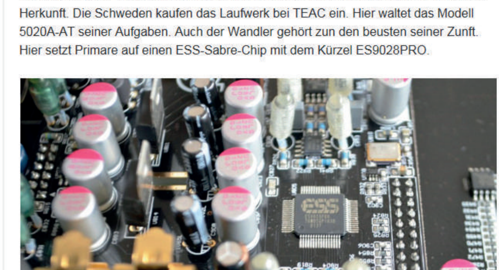
Der ESS Sabre Chip ist mit das modernste, was man heute im DAC-Bereich kaufen kann. Der Chip kann bis zu PCM 384 kHz und DSD 128 wandeln

Wer die Lade ausfährt, sieht das Übliche: viel Kunststoff. Die Zeiten, in denen CD-Laufwerke aus dem vollen Metall gefräst wurden, sind vorbei. Also muss sich auch Primare mit einer Kunststofflade bescheiden. Das Gesamtlaufwerk ist aber von bester Herkunft. Die Schweden kaufen das Laufwerk bei TEAC ein. Hier waltet das Modell 5020A-AT seiner Aufgaben. Auch der Wandler gehört zu den besten seiner Zunft. Hier setzt Primare auf einen ESS-Sabre-Chip mit dem Kürzel ES9028PRO.