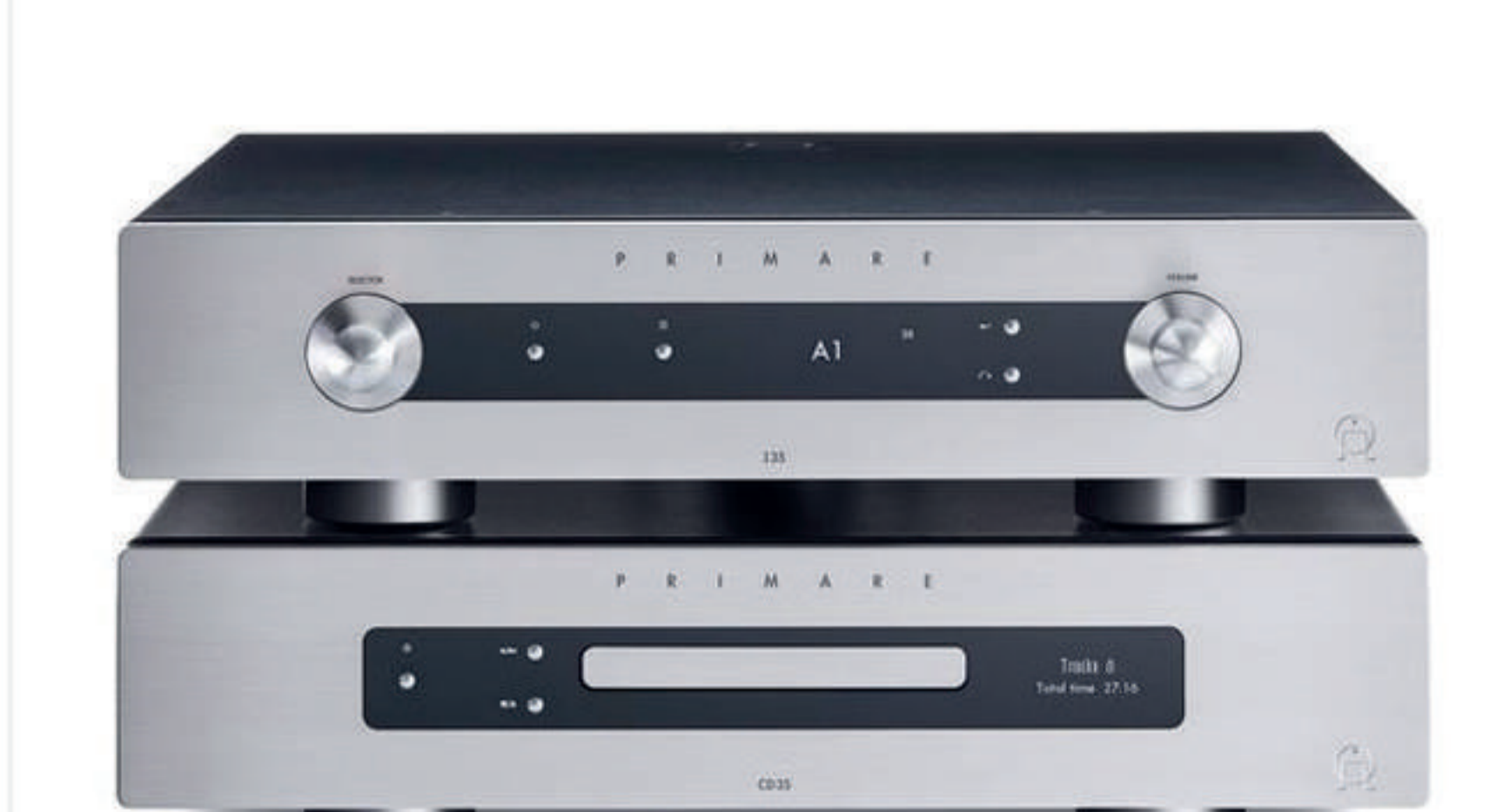
Die neue 35er Linie von Primare gefällt wieder mit ausgesprochen nobler Linienführung. Hier der CD-Player CD 35 (unten) mit dem passenden Vollverstärker i35

Wer zu den Primares will, muss einen kleinen Umweg auf sich nehmen. Die Fertigung und Verwaltung residiert in Limhamn. Das ist ein recht idyllischer Vorort von Malmö. Wir sind also in Schweden. Reisen aber über Dänemark an. Am besten fliegt man nach Kopenhagen. Der Flughafen liegt im Südosten, direkt am Meer. Vor allem ist er verbunden mit einer Autobahn und einer Schnellzugstrecke. Richtung ostwärts geht es über das Meer und in wenigen Minuten ist Malmö erreicht. So funktioniert inner-europäisches Zusammenleben. Malmö ist nach Stockholm und Göteborg die drittgrößte Stadt des Landes. Das weithin sichtbare Erkennungszeichen ist der „Turning Torso“ – ein 190 Meter hoher Wohnturm des Star-Architekten Santiago Calatrava. Man versteht sich hier auf die mutige Schönheit des Designs. Primare hat sich hier angesiedelt. Auch die schwedische High-End-Schmiede macht seit jeher mit atemberaubenden Design-Entwürfen auf sich aufmerksam. Und auf exzellenten Klang. Und das beste Beispiel ist der brandneue CD-Player Primare CD35, den LowBeats exklusiv im Test hatte.