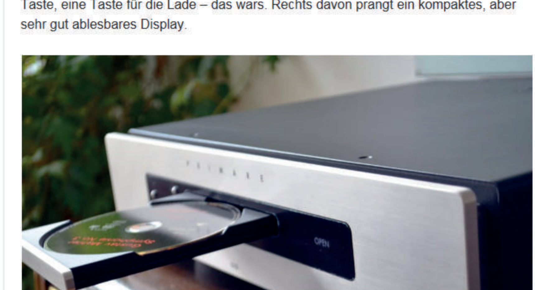
Die Laufwerksmechanik kommt von TEAC und ist fraglos mit das Beste, was man heutzutage in diesem Bereich bekommen kann. Gut zu sehen: die charakteristisch abgesetzte Metallfront bei Primare

Der Primare CD35 strahlt die Philosophie der Schweden geradezu vorbildlich aus. Hier herrscht das wunderbar unaufgeregte Design: Kein Prahlern durch Wucht und Knöpfchen. Überall nur edles Understatement. Ein winziger Einschaltknopf, eine Skip-Taste, eine Taste für die Lade – das wars. Rechts davon prangt ein kompaktes, aber sehr gut ablesbares Display.