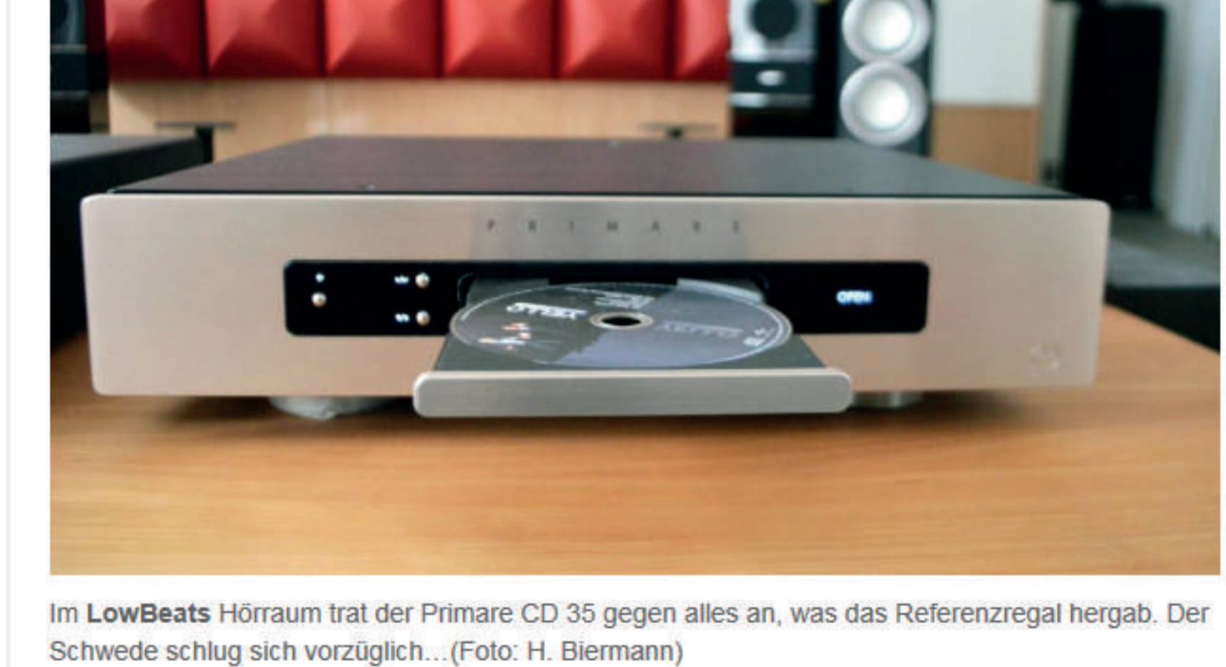
Im LowBeats Hörraum trat der Primare CD 35 gegen alles an, was das Referenzregal hergab. Der Schwede schlägt sich vorzüglich...

Der Primare CD35 ist ein CD-Player für Feingeister. Für all jene, die eigentlich mit der CD und ihrem veralteten Codec abgeschlossen haben. Der CD35 verleiht dem audiophilen Spiel die nötige Portion analoge Sittsamkeit. Das wirkte in unserem Test stets spielfreudig, informativ, doch nie hart. Das können nur wenige CD-Player – und wenn, so liegen sie in der Preisgestaltung deutlich höher.