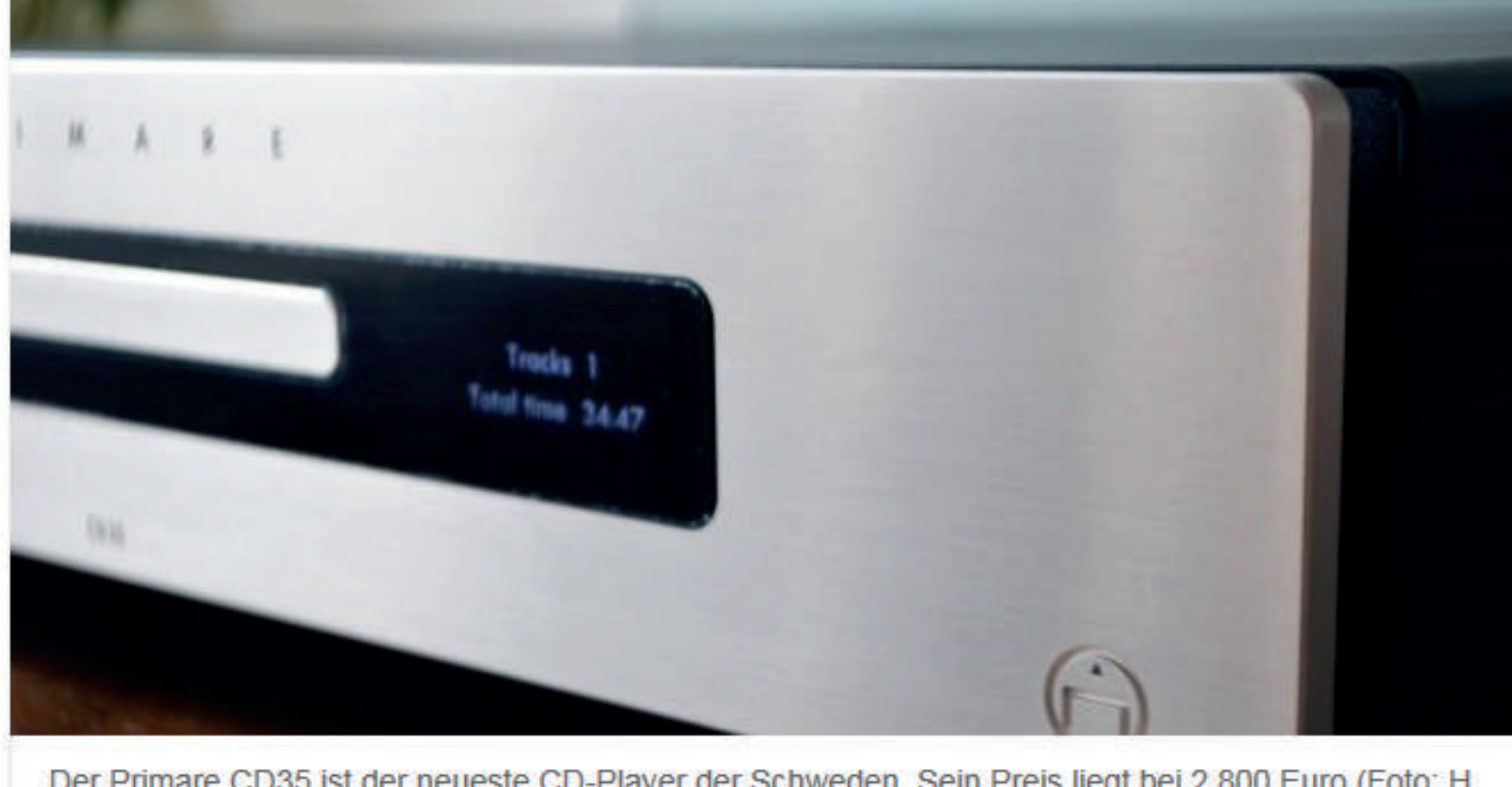
Der Primare CD35 ist der neueste CD-Player der Schweden. Sein Preis liegt bei 2.800 Euro